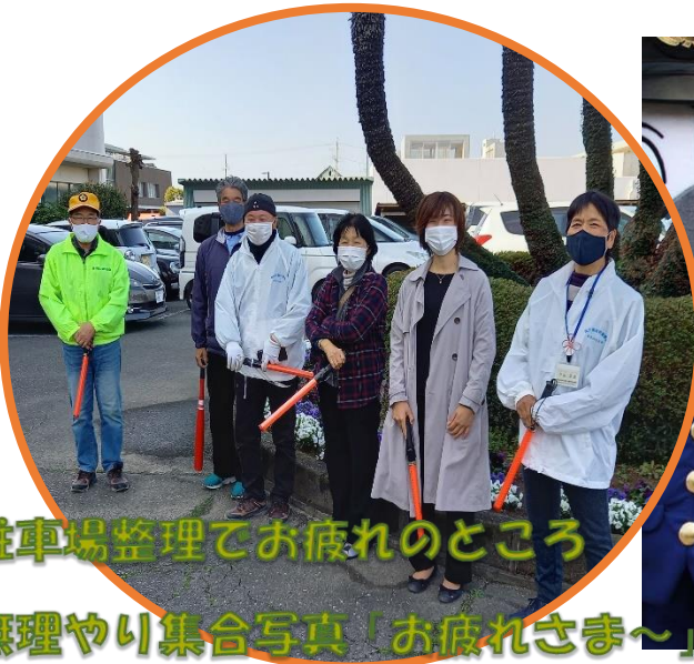
駐車場整理でお疲れのところ 無理やり集合写真「お疲れさま～」